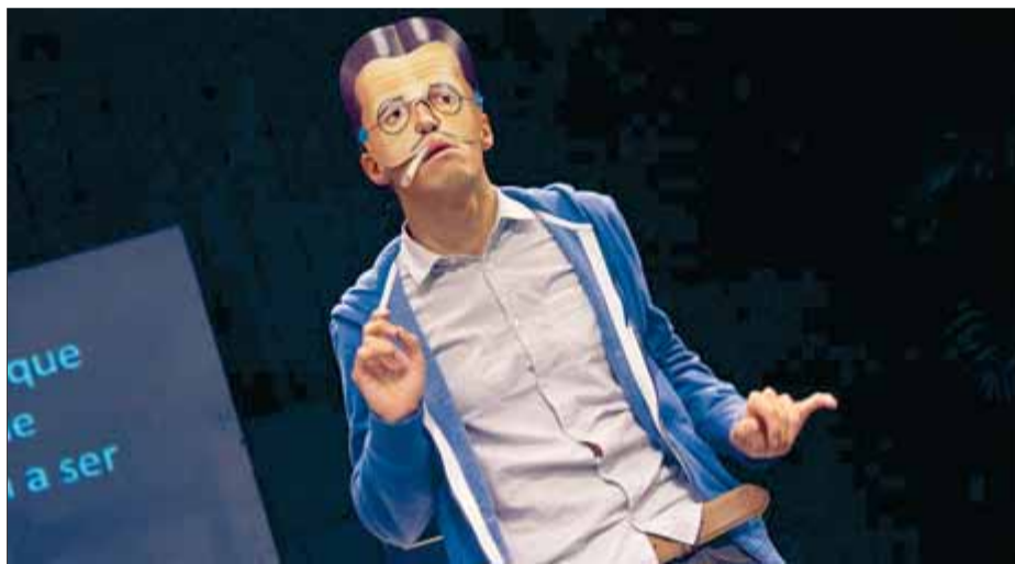
Una escena de 'Montserrat'

El col·lectiu mexicà Lagartijas Tiradas al Sol manté la seva reflexió sobre el magnetisme que genera un actor que narra un fet personal al públic, de com reconstrueix el relat i, així, adapta la veritat al seu gust. En aquesta ocasió Rodríguez (que va visitar l'Abadia de Montserrat el 2011, tot debutant al Temporada Alta) mostra el resultat d'indagar sobre qui va ser la seva mare. Ella va morir quan l'actor tenia 6 anys i la curiositat va arrencar en descobrir una carta, en una data molt propera a la mort d'ella, al seu pare, en què no quadrava en l'agonia vital. Va descobrir que, en realitat, la partida de defunció era falsa. I des-