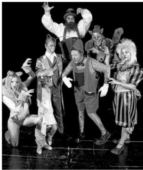
Pinotxo , envoltat d'altres personatges que l'acompanyen en aquest espectacle d'Il Circo Italiano ■ WWW.ILCIRCOITALIANO.COM