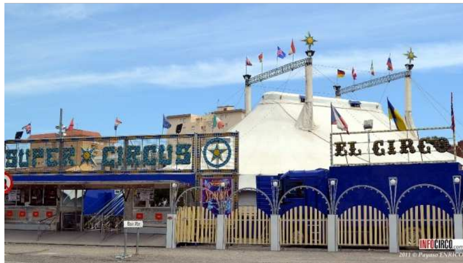
Circo Italiano - Monti i Cia - 2011