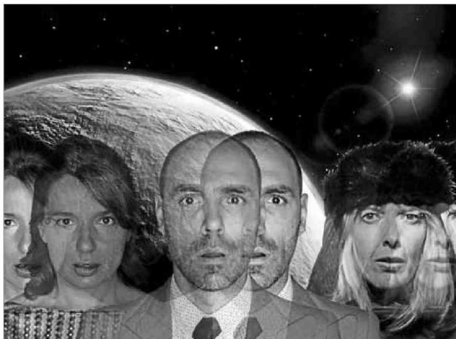
Imatge promocional de l'espectacle 'Conseqüències del pim pam'

Ja és un clàssic en les peces de Pujolràs el fet que no es puguin revelar gaires coses de la trama, ja que és un autor que es deleix per crear expectatives en el públic, pels girs argumentals, i Conseqüències del pim pam no és aliena a aquesta tendència. L'obra explica la història d'una, la Berta i l'Ignasi, que viuen a